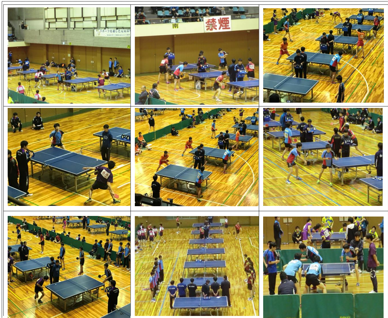
12校リーグで強豪相手に奮闘する選手たち 頑張れ浦高！