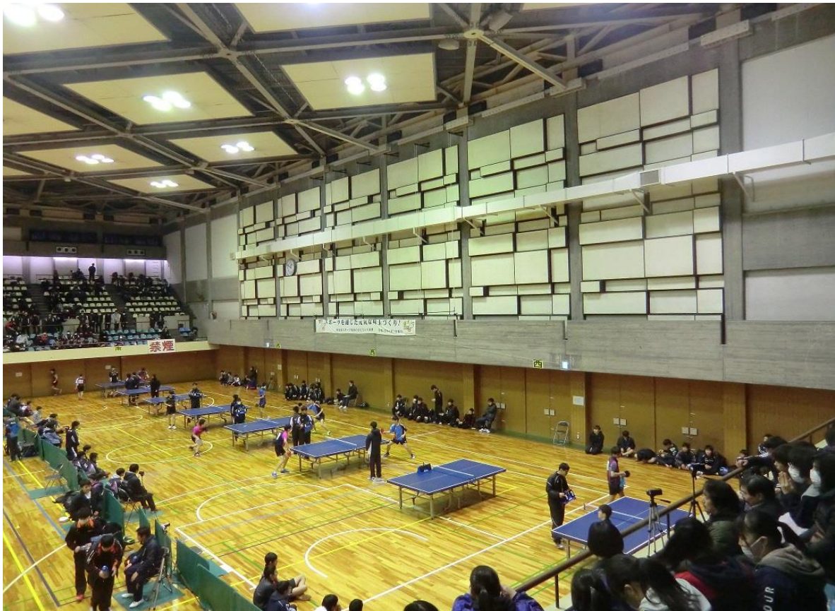
県大会 団体 1回戦 対 埼玉平成高校